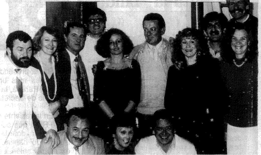
La Comisión Directiva entrerriana festejando

Fue una verdadera fiesta, donde se pudo compartir con calidez y alegría, todo lo que nos une y que a pesar de la crisis, se puede, con el esfuerzo solidario, construir espacios para desarrollar proyectos de participación con la gente.