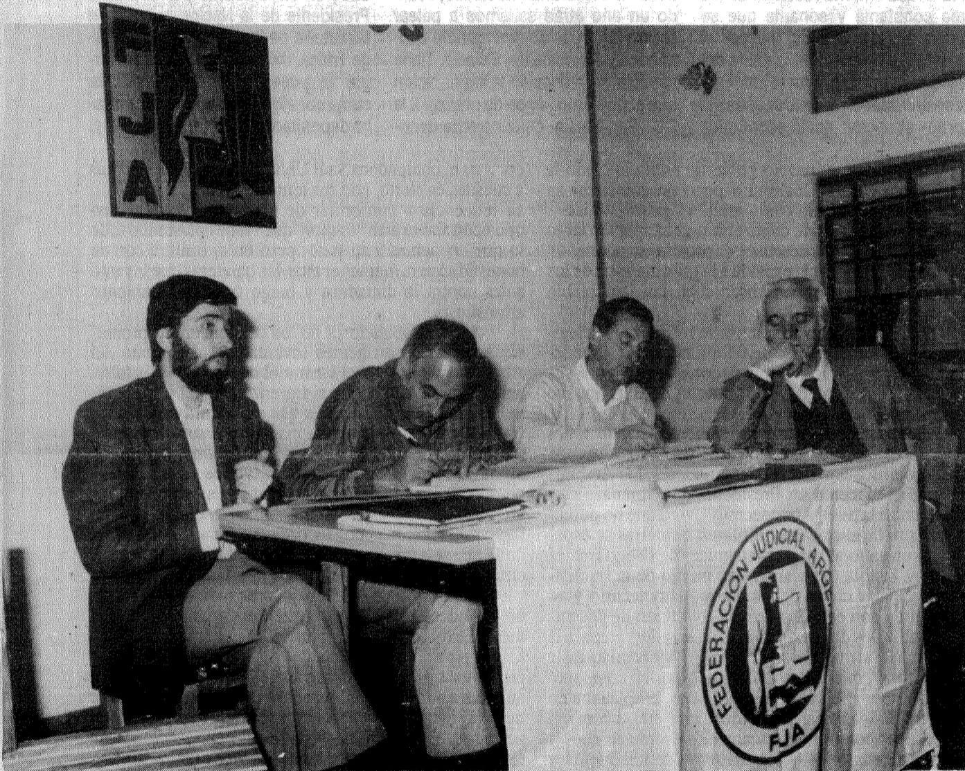
Plenario en Paraná-Entre Ríos - 23/09/90

Sesionó en Paraná el Plenario de Secretarios Generales de la Federación Judicial Argentina, con la participación de 15 filiales, entre ellas la UEJN, quien se integra definitiva y formalmente a la vida federativa con su nueva conducción. Los plenaristas decidieron una Jornada Nacional de Protesta para el día 25/09/90, denunciando la política salarial que afecta a los judiciales de todo el país, reclamando la plena vigencia de la ley porcentual en todo el territorio, repudiando los atrasos en los pagos y los ataques al derecho de huelga.