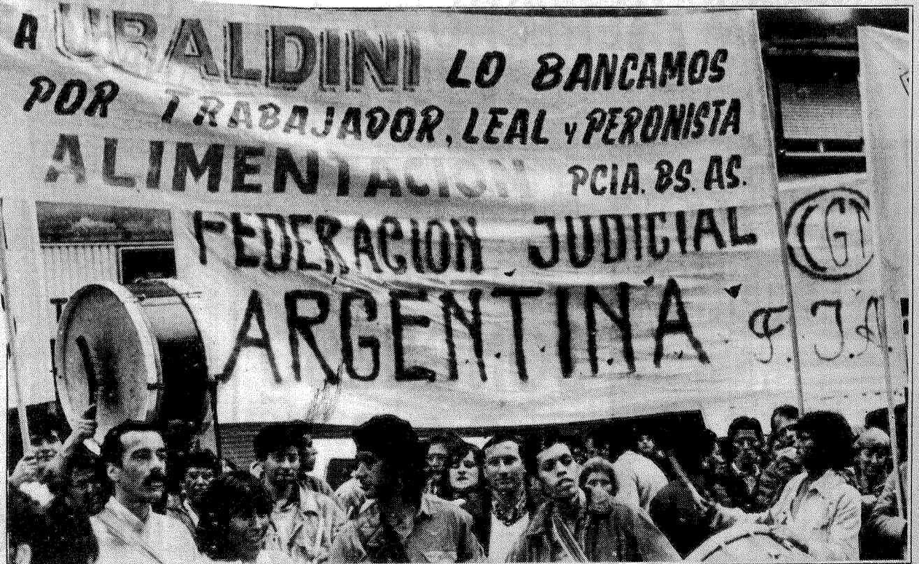
Congreso C.G.T. 10/10/89 Teatro Gral. San Martín

En ese marco los trabajadores judiciales a través de la Federación Judicial Argentina, mantenemos firmes nuestra banderas, de pluralismo ideológico, federalismo, participación plena de las bases, cambiando las estructuras gremiales desde abajo hacia arriba y a partir de esas concepciones, estamos decididos a expandir nuestra ideas hacia las bases de las organizaciones hermanas, a discutir las luego con sus conducciones y a tratar que esa CGT a la que adherimos se transforme definitivamente en la herramienta que los trabajadores de todo el país esperan tener, para enfrentar este desvastador plan económico liberal que parece no dejar nada en pie.