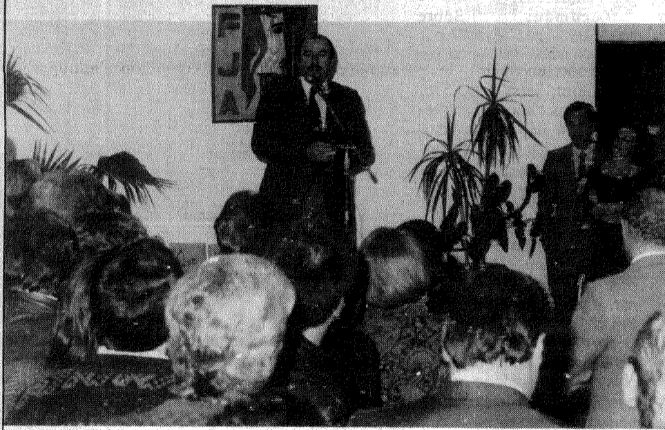
Gobernador de la Pcia. de Entre Ríos Pedro Busti